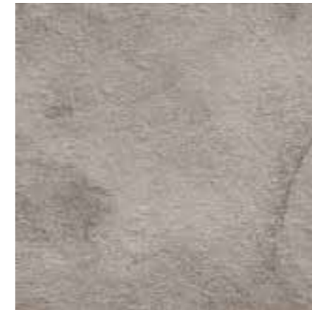
R46L Stoneway_Barge Grigio XT20 60x60