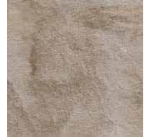
R46K Stoneway_Barge Beige XT20 60x60