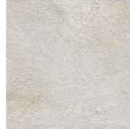
R46J Stoneway_Barge Bianco XT20 60x60